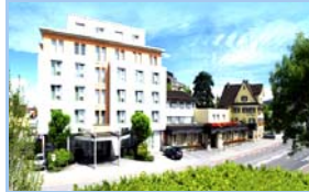
Hotel Gasthof Krone