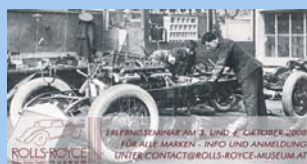
Rolls Royce Museum