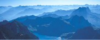
Vorarlberg von oben (Ariel View)