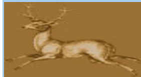
Hotel Restaurant Hirschen