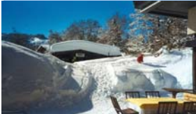
Berghof Fetzt, Bödele