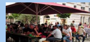
21 Café und mehr