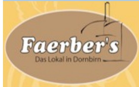
Faerber's Das Lokal in Dornbirn