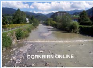
DORNBI RN ONLINE