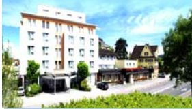
Hotel Gasthof Krone