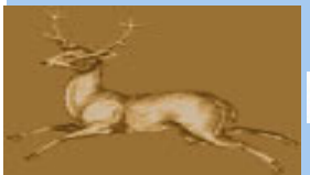
Hotel Restaurant Hirschen