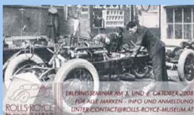
Rolls Royce Museum