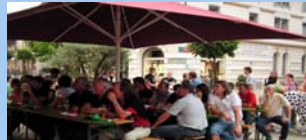
21 Café und mehr